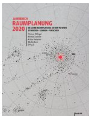
Raumplanung. Jahrbuch 2020 Ladenpreis: 78,00 EUR