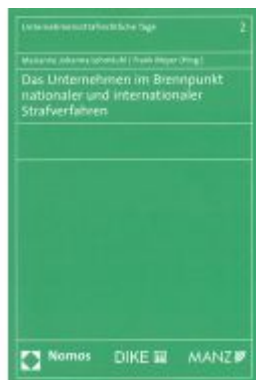
Das Unternehmen im Brennpunkt nationaler und internationaler Strafverfahren Ladenpreis: 64,00 EUR