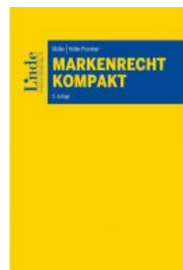
Markenrecht kompakt Ladenpreis: 49,00 EUR