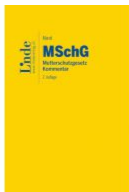
MSchG | Mutterschutzgesetz Ladenpreis: 69,00 EUR