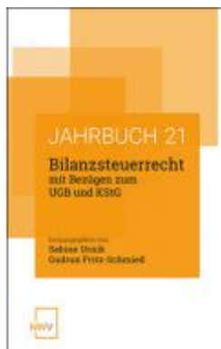
Bilanzsteuerrecht mit Bezügen zum UGB und KStG Ladenpreis: 58,00 EUR