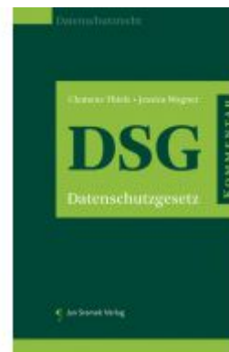
SET Kommentar zur DS-GVO und Kommentar zum DSGVO Ladenpreis: 248,00 EUR