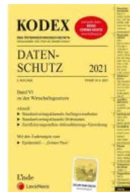
KODEX Datenschutz 2021 Ladenpreis: 65,00 EUR