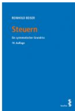
Steuern Ladenpreis: 49,00 EUR