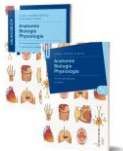
Lernpaket Anatomie, Biologie, Physiologie I Ladenpreis: 56,90EUR