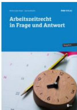
Arbeitszeitrecht in Frage und Antwort