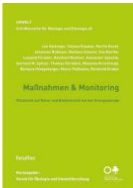
Maßnahmen & Monitoring Ladenpreis: 19,90EUR

Wir haben andere Produkte gefunden, die Ihnen gefallen könnten!