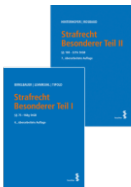
Kombipaket Strafrecht Besonderer Teil I und Besonderer Teil II Ladenpreis: 82,00EUR