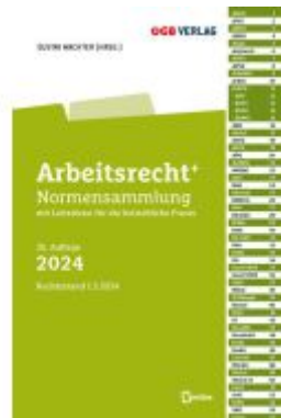
Arbeitsrecht+ Ladenpreis: 65,00EUR