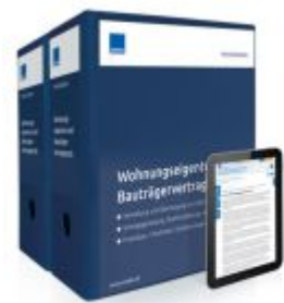
Wohnungseigentum und Bauträgervertragsrecht Ladenpreis: 261,80EUR