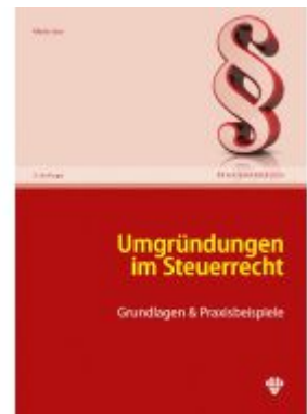
Umgründungen um Steuerrecht Ladenpreis: 59,40EUR