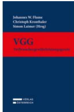
VGG - Verbrauchergewährleistungsgesetz Ladenpreis: 139,00EUR