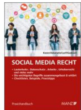
Social Media Recht Ladenpreis: 42,00EUR