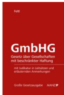
GmbHG Ladenpreis: 198,00EUR