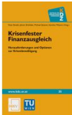
Krisenfester Finanzausgleich Ladenpreis: 44,80EUR