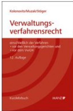
Grundriss des österreichischen Verwaltungsverfahrensrechts Ladenpreis: 72,00EUR