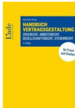
Handbuch Vertragsgestaltung Ladenpreis: 115,00EUR