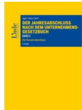
Der Jahresabschluss nach dem Unternehmensgesetzbuch, Band 2 Ladenpreis: 90,00EUR