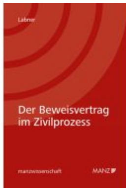
Der Beweisvertrag im Zivilprozess Ladenpreis: 52,00EUR

Wir haben andere Produkte gefunden, die Ihnen gefallen könnten!