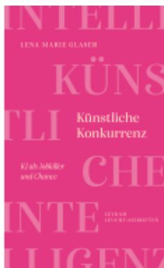
Künstliche Konkurrenz – KI als Jobkiller und Chance

Wir haben andere Produkte gefunden, die Ihnen gefallen könnten!