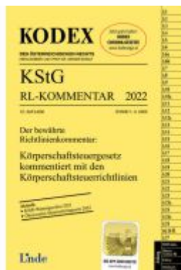
KODEX KStG Richtlinien-Kommentar 2022