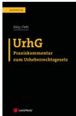
UrhG Ladenpreis: 124,00EUR