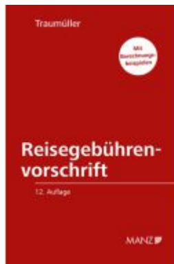
Reisegebührenvorschrift der Bundesbediensteten Ladenpreis: 68,00EUR