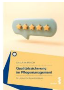
Qualitätssicherung im Pflegemanagement