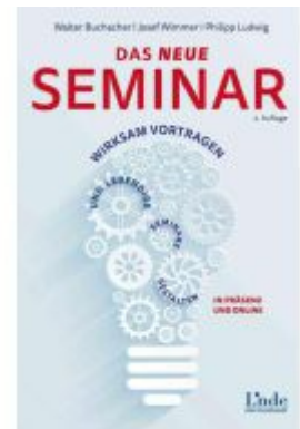
Das neue Seminar Ladenpreis: 29,90EUR