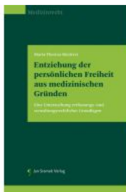
Entziehung der persönlichen Freiheit aus medizinischen Gründen