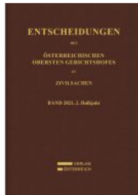
Entscheidungen des Obersten Gerichtshofes in Zivilsachen Ladenpreis: 169,00EUR