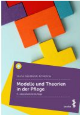
Modelle und Theorien in der Pflege Ladenpreis: 32,90EUR