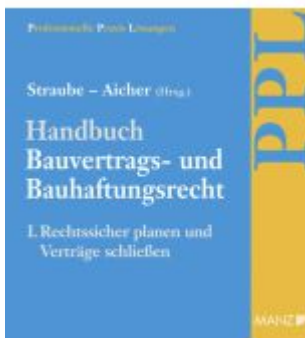
PAKET: Handbuch Bauvertrags- und Bauhaftungsrecht Band I: Rechtssicher Planen Ladenpreis: 199,00EUR

Wir haben andere Produkte gefunden, die Ihnen gefallen könnten!