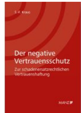
Der negative Vertrauensschutz Ladenpreis: 138,00EUR