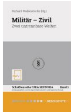
Militär — Zivil Ladenpreis: 88,00EUR