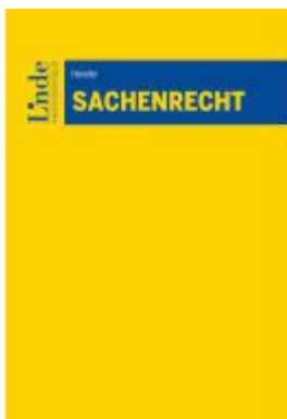
Sachenrecht Ladenpreis: 40,00EUR