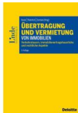
Übertragung und Vermietung von Immobilien Ladenpreis: 64,00EUR