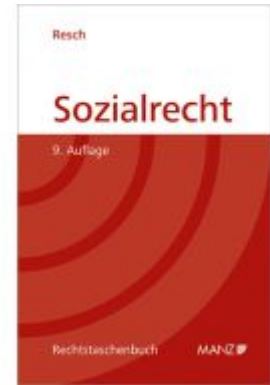
Sozialrecht Ladenpreis: 39,20EUR