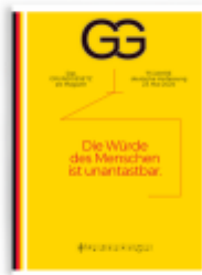
Das Grundgesetz als Magazin - 75 Jahre Ladenpreis: 10,00EUR