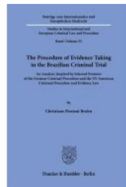
The Procedure of Evidence Taking in the Brazilian Criminal Trial. Ladenpreis: 92,50EUR