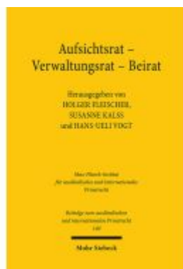
Aufsichtsrat - Verwaltungsrat - Beirat Ladenpreis: 107,00EUR