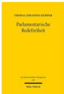
Parlamentarische Redefreiheit Ladenpreis: 91,50EUR

Wir haben andere Produkte gefunden, die Ihnen gefallen könnten!