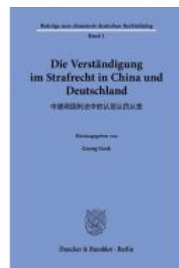
Die Verständigung im Strafrecht in China und Deutschland. Ladenpreis: 71,90EUR