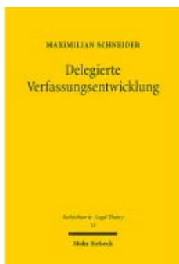
Delegierte Verfassungsentwicklung Ladenpreis: 96,70EUR