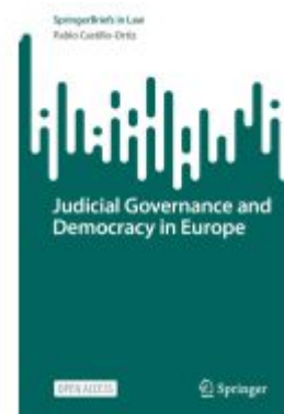
Judicial Governance and Democracy in Europe Ladenpreis: 32,99EUR