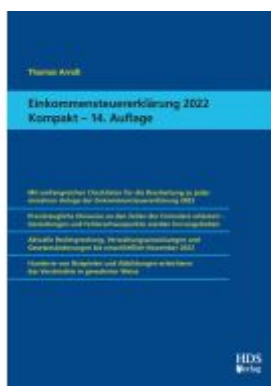
Einkommensteuererklärung 2022 Kompakt Ladenpreis: 51,30EUR