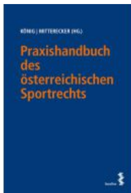
Praxishandbuch des österreichischen Sportrechts Ladenpreis: 220,00EUR

Wir haben andere Produkte gefunden, die Ihnen gefallen könnten!