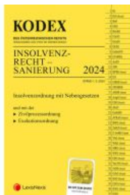
KODEX Insolvenzrecht - Sanierung 2024 - inkl. App Ladenpreis: 37,00EUR