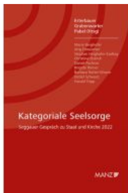
Kategoriale Seelsorge Seggauer Gespräch zu Staat und Kirche 2022 Ladenpreis: 28,00EUR