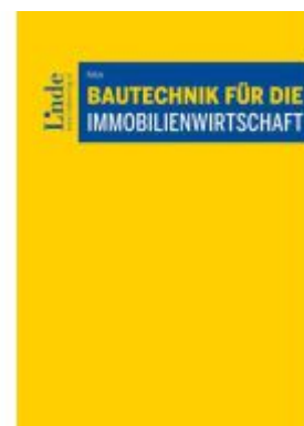
Bautechnik für die Immobilienwirtschaft Ladenpreis: 96,00EUR