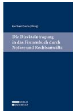
Die Direkteintragung in das Firmenbuch durch Notare und Rechtsanwälte Ladenpreis: 39,00EUR