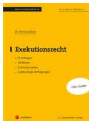
Exekutionsrecht (Skriptum) Ladenpreis: 26,25EUR