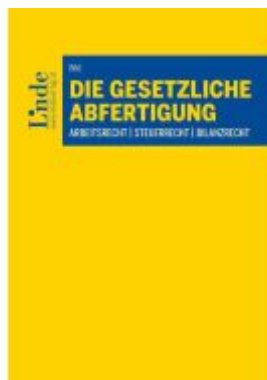
Die gesetzliche Abfertigung Ladenpreis: 29,00EUR