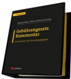
Gebührengesetz Kommentar Ladenpreis: 282,00EUR