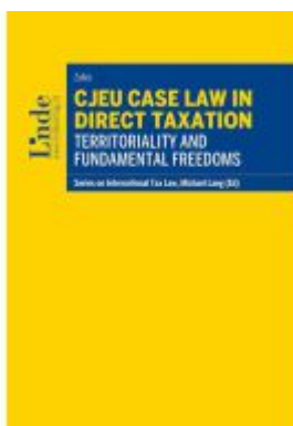
CJEU Case Law in Direct Taxation: Territoriality and Fundamental Freedoms Ladenpreis: 82,00EUR