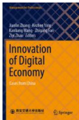
Innovation of Digital Economy Ladenpreis: 76,99EUR