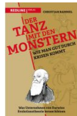
Der Tanz mit den Monstern – Wie man gut durch Krisen kommt Ladenpreis: 22,70EUR