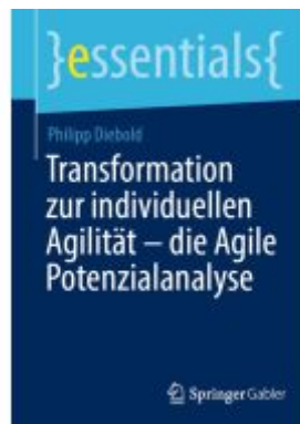
Transformation zur individuellen Agilität – die Agile Potenzialanalyse Ladenpreis: 15,41EUR