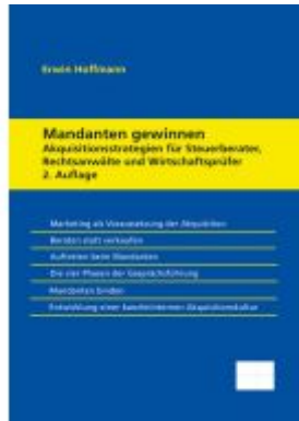
Mandanten gewinnen –

Akquisitionstrategien für Steuerberater, Rechtsanwälte und Wirtschaftsprüfer