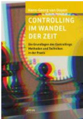
Controlling im Wandel der Zeit