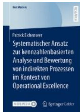
Systematischer Ansatz zur kennzahlenbasierten Analyse und Bewertung von indirekten Prozessen im Kontext von Operational Excellence Ladenpreis: 71,95EUR