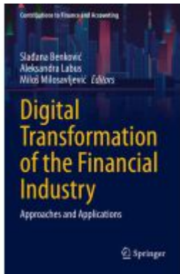
Digital Transformation of the Financial Industry