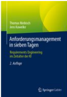
Anforderungsmanagement in sieben Tagen Ladenpreis: 51,39EUR