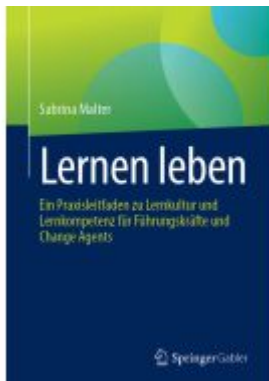
Lernen leben Ladenpreis: 39,06EUR

Wir haben andere Produkte gefunden, die Ihnen gefallen könnten!