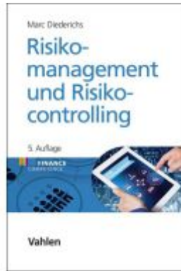
Risikomanagement und Risikocontrolling Ladenpreis: 81,30EUR