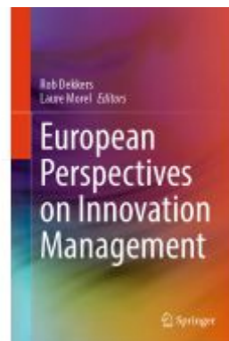
European Perspectives on Innovation Management Ladenpreis: 329,99EUR