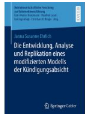
Die Entwicklung, Analyse und Replikation eines modifizierten Modells der Kündigungsabsicht Ladenpreis: 77,10EUR