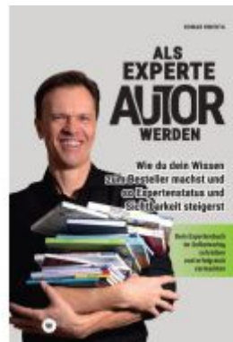
Als Experte Autor werden Ladenpreis: 24,97EUR