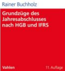
Grundzüge des Jahresabschlusses nach HGB und IFRS Ladenpreis: 29,80EUR