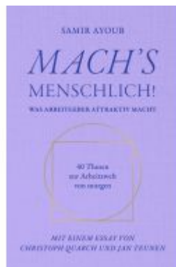
MACH'S MENSCHLICH! Ladenpreis: 20,00EUR