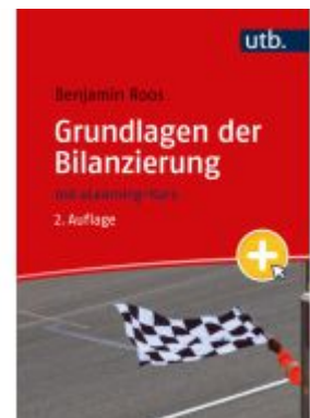
Grundlagen der Bilanzierung Ladenpreis: 41,10EUR