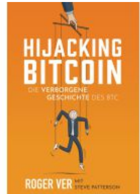
Hijacking Bitcoin Ladenpreis: 20,50EUR