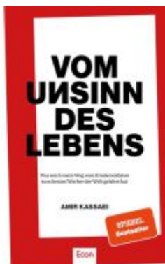
Vom Unsinn des Lebens Ladenpreis: 25,70EUR