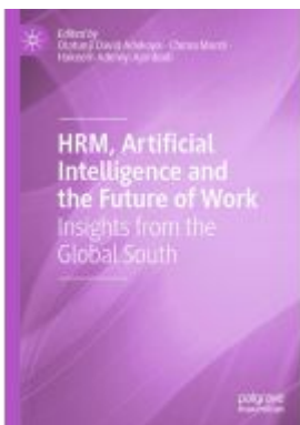
HRM, Artificial Intelligence and the Future of Work Ladenpreis: 186,99EUR