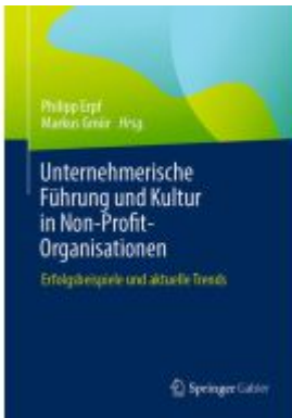
Unternehmerische Führung und Kultur in Non-Profit-Organisationen Ladenpreis: 56,53EUR