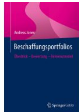
Beschaffungsportfolios Ladenpreis: 39,05EUR