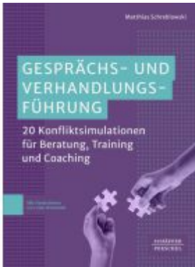
Gesprächs- und Verhandlungsführung Ladenpreis: 41,20EUR