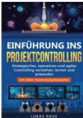
Einführung ins Projektcontrolling Ladenpreis: 16,40EUR

Wir haben andere Produkte gefunden, die Ihnen gefallen könnten!