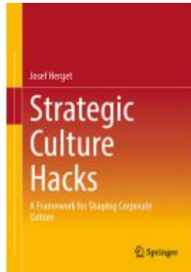
Strategic Culture Hacks Ladenpreis: 65,99EUR