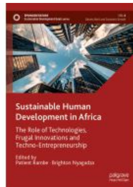
Sustainable Human Development in Africa Ladenpreis: 186,99EUR