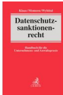
Datenschutzsanktionenrecht Ladenpreis: 163,50EUR