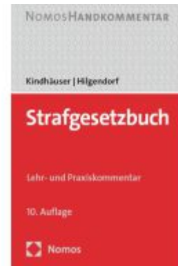
Strafgesetzbuch Ladenpreis: 60,70EUR