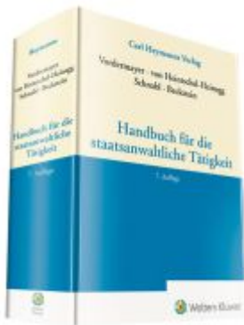
Handbuch für die staatsanwaltliche Tätigkeit Ladenpreis: 173,80EUR