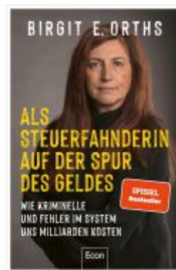
Als Steuerfahnderin auf der Spur des Geldes Ladenpreis: 20,60EUR