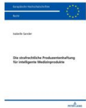
Die strafrechtliche Produzentenhaftung für intelligente Medizinprodukte Ladenpreis: 56,50EUR