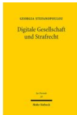
Digitale Gesellschaft und Strafrecht Ladenpreis: 107,00EUR