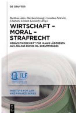
Wirtschaft – Moral – Strafrecht Ladenpreis: 129,95EUR