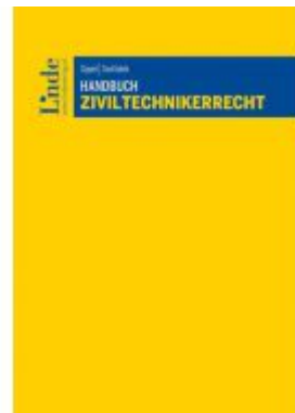
Handbuch Ziviltechnikerrecht Ladenpreis: 99,00EUR