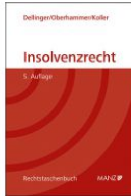
Insolvenzrecht Ladenpreis: 48,00EUR