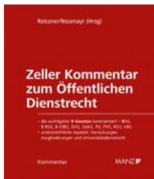
Zeller Kommentar zum Öffentlichen Dienstrecht Ladenpreis: 328,00EUR