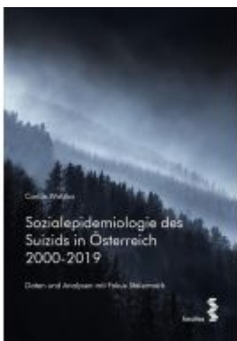
Sozialepidemiologie des Suizids in Österreich 2000-2019 Ladenpreis: 26,90EUR