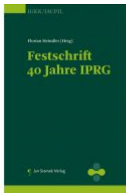
Festschrift 40 Jahre IPRG Ladenpreis: 98,00EUR