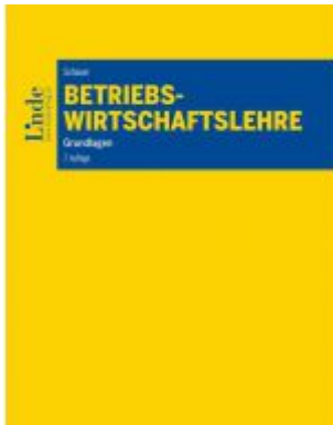
Betriebswirtschaftslehre Ladenpreis: 35,00EUR