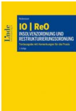
IO | ReO Insolvenzordnung und Restrukturierungsordnung Ladenpreis: 89,00EUR