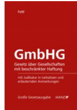
GmbHG Ladenpreis: 198,00EUR