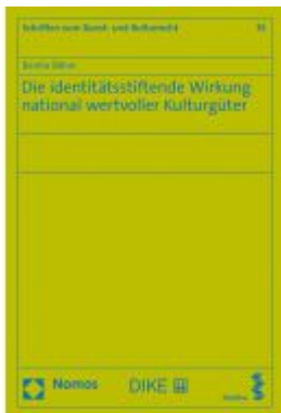
Die identitätsstiftende Wirkung national wertvoller Kulturgüter Ladenpreis: 55,60EUR

Wir haben andere Produkte gefunden, die Ihnen gefallen könnten!