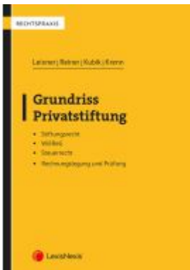
Grundriss Privatstiftung Ladenpreis: 29,00EUR