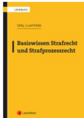
Basiswissen Strafrecht und Strafprozessrecht Ladenpreis: 39,00EUR