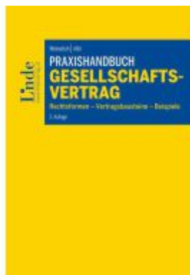
Praxishandbuch Gesellschaftsvertrag Ladenpreis: 74,00EUR