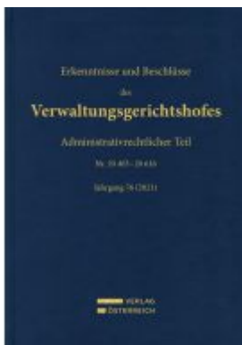
Erkenntnisse und Beschlüsse des Verwaltungsgerichtshofes Ladenpreis: 549,00EUR