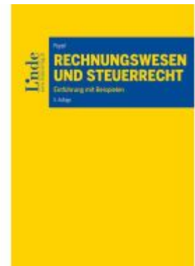
Rechnungswesen und Steuerrecht Ladenpreis: 41,00EUR