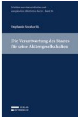
Die Verantwortung des Staates für seine Aktiengesellschaften Ladenpreis: 49,00EUR