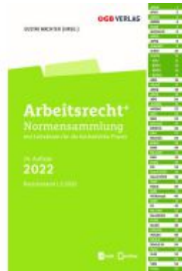
Arbeitsrecht+ Ladenpreis: 59,00EUR