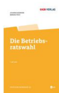
Die Betriebsratswahl Ladenpreis: 69,00EUR