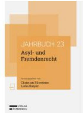
Asyl- und Fremdenrecht Ladenpreis: 88,00EUR