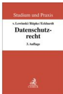
Datenschutzrecht Ladenpreis: 51,20EUR