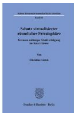
Schutz virtualisierter räumlicher Privatsphäre Ladenpreis: 113,00EUR