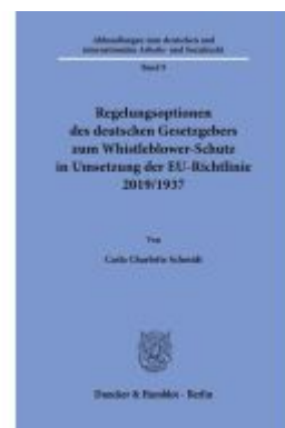
Regelungsoptionen des deutschen Gesetzgebers zum Whistleblower-Schutz in Umsetzung der EU-Richtlinie 2019-1937. Ladenpreis: 113,00EUR