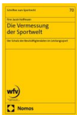
Die Vermessung der Sportwelt Ladenpreis: 91,50EUR