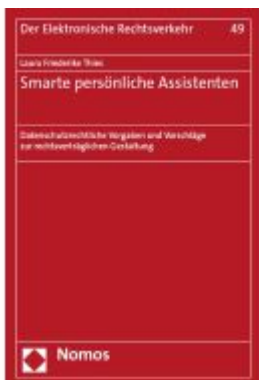
Smarte persönliche Assistenten Ladenpreis: 168,60EUR