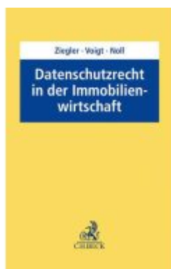
Datenschutz in der Immobilienwirtschaft Ladenpreis: 50,40EUR