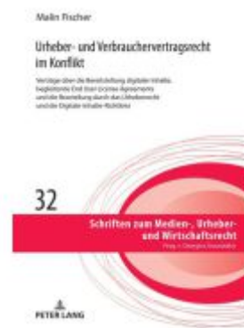
Urheber- und Verbrauchervertragsrecht im Konflikt Ladenpreis: 56,50EUR