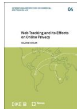
Web Tracking and its Effects on Online Privacy Ladenpreis: 98,70EUR