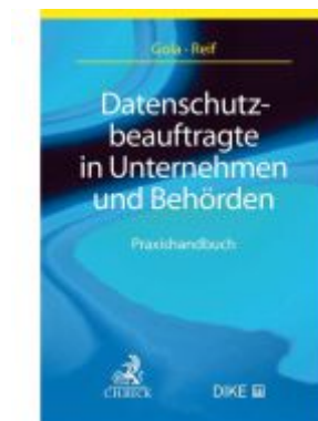
Datenschutzbeauftragte in Unternehmen und Behörden Ladenpreis: 50,40EUR