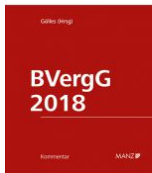
BVergG 2018 Ladenpreis: 298,00EUR