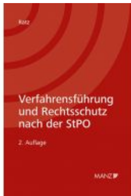
Verfahrensführung und Rechtsschutz nach der StPO Ladenpreis: 98,00EUR

Wir haben andere Produkte gefunden, die Ihnen gefallen könnten!