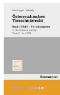
Österreichisches Tierschutzrecht Ladenpreis: 98,00EUR