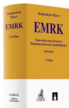
EMRK Ladenpreis: 139,00EUR