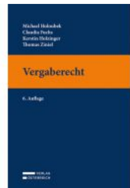
Vergaberecht Ladenpreis: 36,00EUR