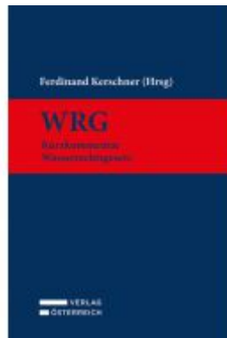
WRG - Wasserrechtsgesetz Ladenpreis: 269,00EUR