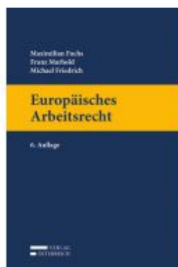
Europäisches Arbeitsrecht Ladenpreis: 99,00EUR