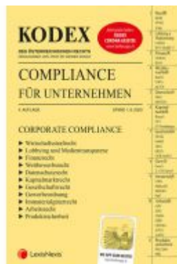
KODEX Compliance für Unternehmen 2020 Ladenpreis: 73,00EUR