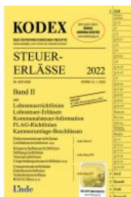
KODEX Steuer-Erlässe 2022, Band II Ladenpreis: 35,00EUR