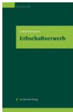
Erbschaftserwerb Ladenpreis: 98,00EUR