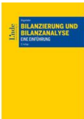
Bilanzierung und Bilanzanalyse Ladenpreis: 58,00EUR