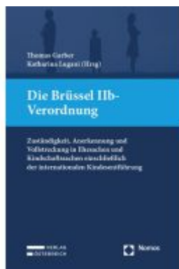
Die Brüssel IIb-Verordnung Ladenpreis: 149,00EUR