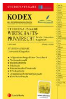
KODEX Wirtschaftsprivatrecht Klagenfurt 2023 - inkl. App Ladenpreis: 23,00EUR