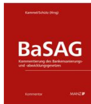
BaSAG - Bankensanierungs- und - abwicklungsgesetz Ladenpreis: 298,00EUR