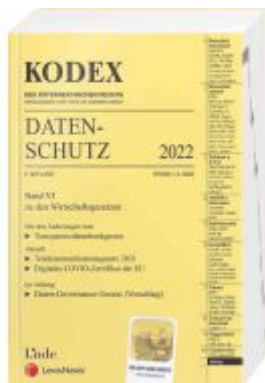
KODEX Datenschutz 2022 Ladenpreis: 65,00EUR