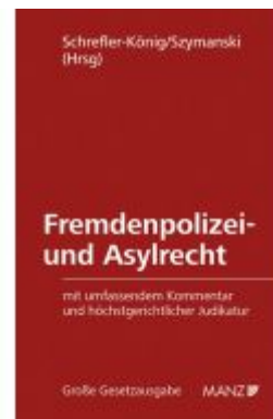
Fremdenpolizei- und Asylrecht Ladenpreis: 240,00EUR