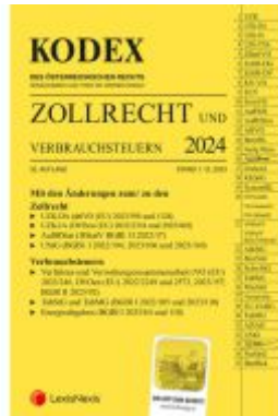
KODEX Zollrecht 2024 - inkl. App Ladenpreis: 119,00EUR