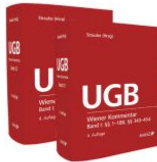
Wiener Kommentar zum UGB PAKET Band 1 + Band 2 Ladenpreis: 578,00EUR