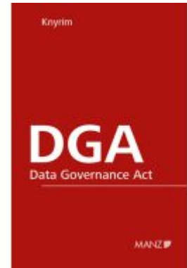
DGA - Data Governance Act Ladenpreis: 34,00EUR