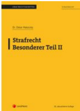
Strafrecht - Besonderer Teil II (Skriptum)