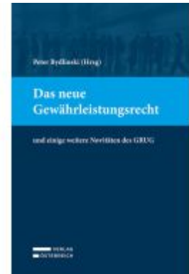
Das neue Gewährleistungsrecht