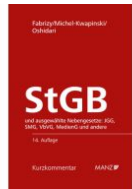
Strafgesetzbuch StGB Ladenpreis: 178,00EUR