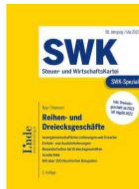
SWK-Spezial Reihen- und Dreiecksgeschäfte Ladenpreis: 48,00EUR