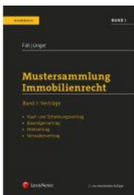
Mustersammlung Immobilienrecht Ladenpreis: 59,00EUR