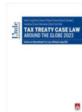
Tax Treaty Case Law around the Globe 2023 Ladenpreis: 95,00EUR