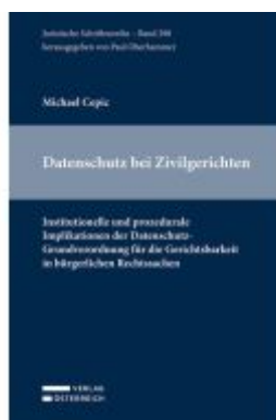
Datenschutz bei den Zivilgerichten Ladenpreis: 77,00EUR