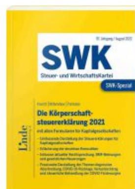
SWK-Spezial Die Körperschaftsteuererklärung 2021 Ladenpreis: 48,00EUR