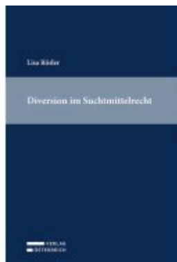
Diversio in Suchtmittelrecht Ladenpreis: 89,00EUR

Wir haben andere Produkte gefunden, die Ihnen gefallen könnten!