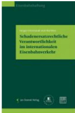
Schadenersatzrechtliche Verantwortlichkeit im internationalen Eisenbahnverkehr Ladenpreis: 44,90 EUR