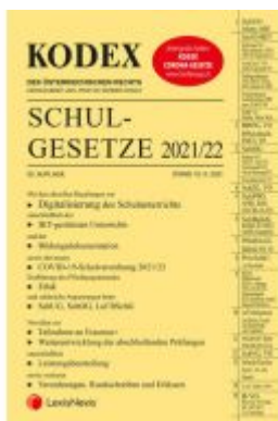
KODEX Schulgesetze 2021/22 Ladenpreis: 71,00 EUR