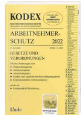
KODEX Arbeitnehmerschutz 2022 Ladenpreis: 39,00 EUR