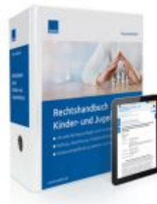
Rechtshandbuch Kinder- und Jugendschutz Ladenpreis: 217,80 EUR