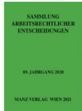
Sammlung arbeitsrechtlicher Entscheidungen Ladenpreis: 264,50 EUR