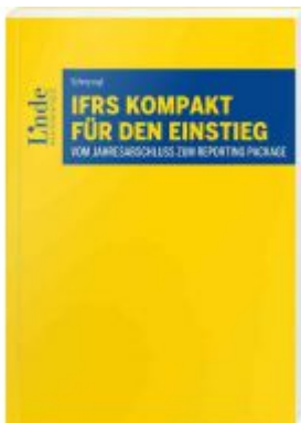
IFRS kompakt für den Einstieg Ladenpreis: 28,00 EUR