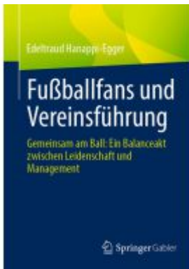
Fußballfans und Vereinsführung Ladenpreis: 46,25EUR