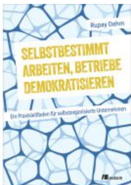
Selbstbestimmt arbeiten, Betriebe demokratisieren Ladenpreis: 43,20EUR

Wir haben andere Produkte gefunden, die Ihnen gefallen könnten!