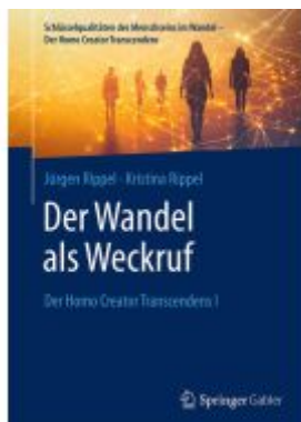
Der Wandel als Weckruf Ladenpreis: 46,25EUR