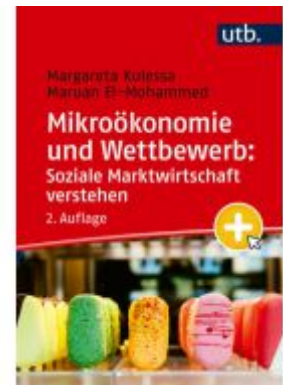
Mikroökonomie und Wettbewerb: Soziale Marktwirtschaft verstehen Ladenpreis: 30,80EUR