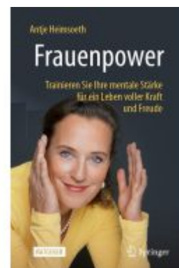
Frauenpower Ladenpreis: 23,63EUR