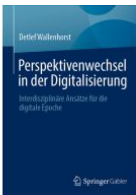
Perspektivenwechsel in der Digitalisierung Ladenpreis: 30,83EUR