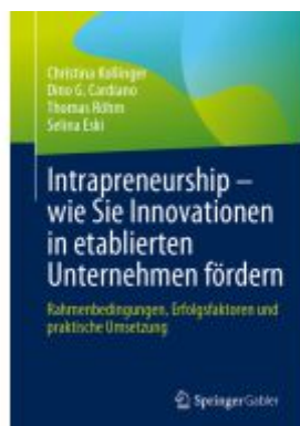
Intrapreneurship – wie Sie Innovationen in etablierten Unternehmen fördern Ladenpreis: 51,39EUR