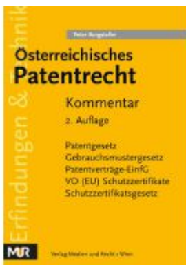
Österreichisches Patentrecht Ladenpreis: 94,00EUR