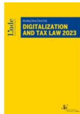
Digitalization And Tax Law 2023 Ladenpreis: 139,00EUR