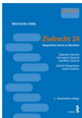
Zivilrecht 24 Ladenpreis: 28,00EUR