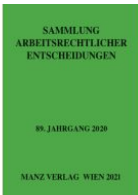
Sammlung arbeitsrechtlicher Entscheidungen Ladenpreis: 264,50EUR

Wir haben andere Produkte gefunden, die Ihnen gefallen könnten!