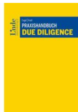
Praxishandbuch Due Diligence Ladenpreis: 68,00EUR