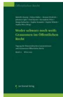
Weder schwarz noch weiß: Grauzonen im Öffentlichen Recht Ladenpreis: 85,00EUR