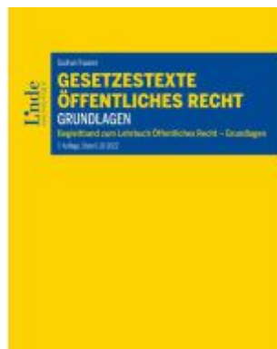
Gesetzestexte Öffentliches Recht - Grundlagen Ladenpreis: 32,00EUR