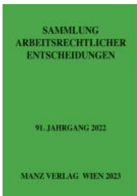
Sammlung arbeitsrechtlicher Entscheidungen Ladenpreis: 98,00EUR