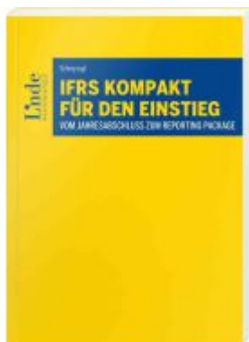
IFRS kompakt für den Einstieg Ladenpreis: 28,00EUR

Wir haben andere Produkte gefunden, die Ihnen gefallen könnten!