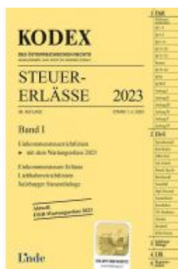
KODEX Steuer-Erlässe 2023, Band I Ladenpreis: 62,00EUR