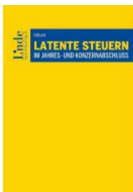
Latente Steuern im Jahres- und Konzernabschluss Ladenpreis: 66,00EUR