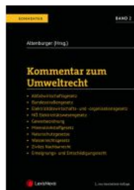
Kommentar zum Umweltrecht Band 2 Ladenpreis: 197,00EUR