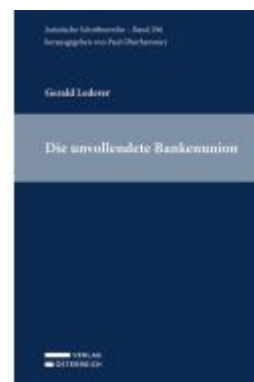
Die unvollendete Bankenunion Ladenpreis: 94,00EUR