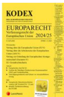
KODEX EU-Verfassungsrecht (Europarecht) 2024/25 - inkl. App Ladenpreis: 43,00EUR