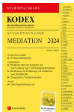
KODEX Mediation Studienausgabe Ladenpreis: 15,00EUR