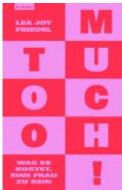
Too Much! Was es kostet, eine Frau zu sein Ladenpreis: 24,50EUR