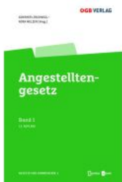
Angestelltesgesetz Ladenpreis: 129,00EUR