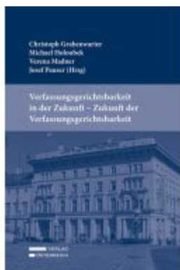
Verfassungsgerichtsbarkeit in der Zukunft - Zukunft der Verfassungsgerichtsbarkeit Ladenpreis: 69,00EUR