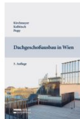
Dachgeschoßausbau in Wien Ladenpreis: 79,00EUR