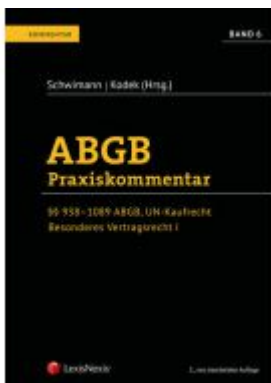
ABGB Praxiskommentar / ABGB Praxiskommentar - Band 6, 5. Auflage Ladenpreis: 219,00EUR

Wir haben andere Produkte gefunden, die Ihnen gefallen könnten!