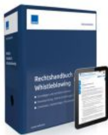
Rechtshandbuch Whistleblowing Ladenpreis: 250,80EUR