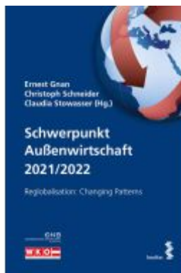
Schwerpunkt Außenwirtschaft 2021/2022 Ladenpreis: 19,80EUR