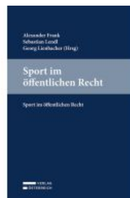
Sport im öffentlichen Recht Ladenpreis: 79,00EUR