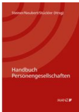
Handbuch Personengesellschaften Ladenpreis: 118,00EUR