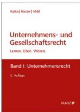
Unternehmens- und Gesellschaftsrecht Ladenpreis: 52,00EUR