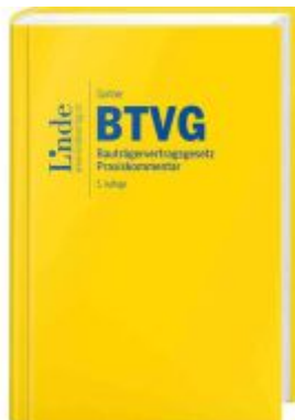
BTVG | Bauträgervertragsgesetz Ladenpreis: 78,00EUR