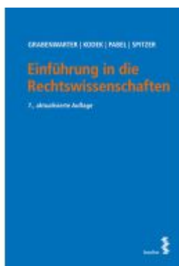
Einführung in die Rechtswissenschaften Ladenpreis: 22,00EUR