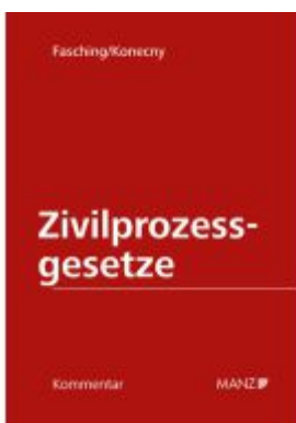
PAKET: Kommentar zu den Zivilprozessgesetzen 3. Auflage Band 1+2/1+2/2+2/3+3/1+3/2+4/1+4/2+5/1+5/2+ 5/3+5/4 Ladenpreis: 2.610,00EUR