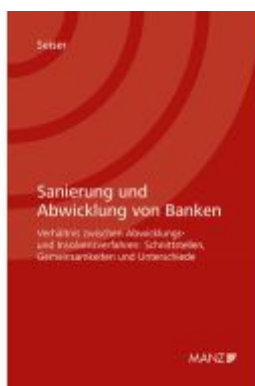
Sanierung und Abwicklung von Banken Ladenpreis: 78,00EUR