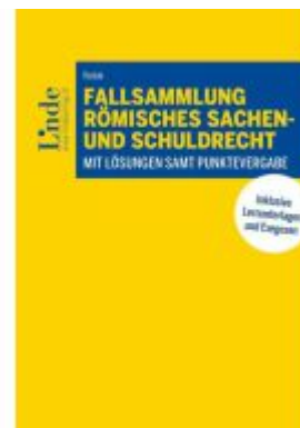
Fallsammlung Römisches Sachen- und Schuldrecht Ladenpreis: 38,00EUR