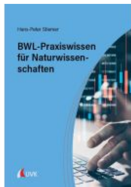
BWL-Praxiswissen für Naturwissenschaften Ladenpreis: 20,50EUR