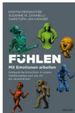
Fühlen Ladenpreis: 30,70EUR