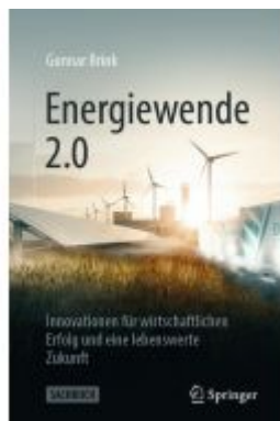
Energiewende 2.0 Ladenpreis: 25,69EUR