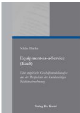
Equipment-as-a-Service (EaaS) – Eine empirische Geschäftsmodellanalyse aus der Perspektive der kundenseitigen Risikowahrnehmung Ladenpreis: 102,60EUR