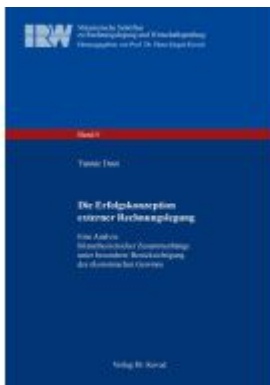
Die Erfolgskonzeption externer Rechnungslegung Ladenpreis: 88,30EUR