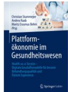
Plattformökonomie im Gesundheitswesen Ladenpreis: 61,67EUR