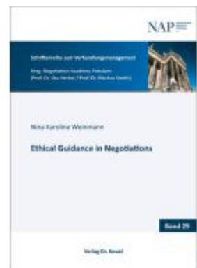
Ethical Guidance in Negotiations Ladenpreis: 101,60EUR