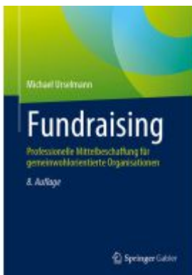
Fundraising Ladenpreis: 82,24EUR