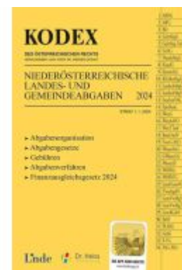
KODEX NÖ Landes- und Gemeindeabgaben Ladenpreis: 26,00EUR