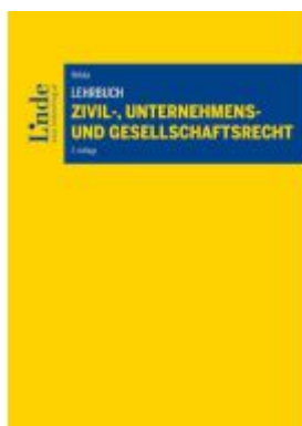
Lehrbuch Zivil-, Unternehmens- und Gesellschaftsrecht Ladenpreis: 55,00EUR