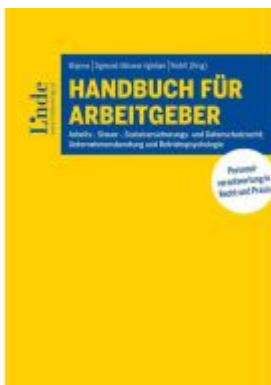
Handbuch für Arbeitgeber Ladenpreis: 78,00EUR