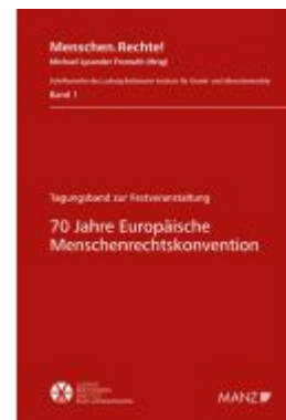
70 Jahre Europäische Menschenrechtskonvention Ladenpreis: 42,00EUR