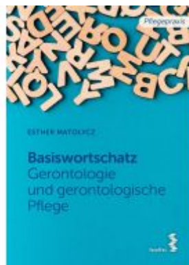
Basiswortschatz Gerontologie und gerontologische Pflege Ladenpreis: 18,90EUR