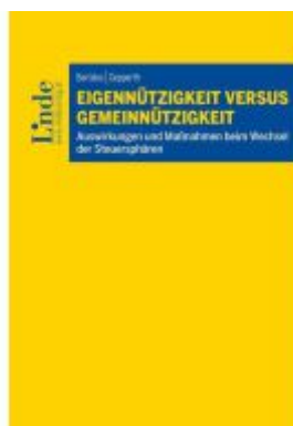
Eigennützigkeit versus Gemeinnützigkeit Ladenpreis: 39,00EUR