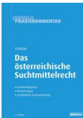
Das österreichische Suchtmittelrecht Ladenpreis: 59,00EUR