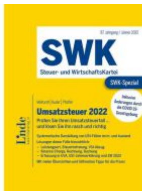
SWK-Spezial Umsatzsteuer 2022 Ladenpreis: 52,00EUR

Wir haben andere Produkte gefunden, die Ihnen gefallen könnten!