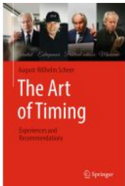
The Art of Timing Ladenpreis: 49,49EUR

Wir haben andere Produkte gefunden, die Ihnen gefallen könnten!