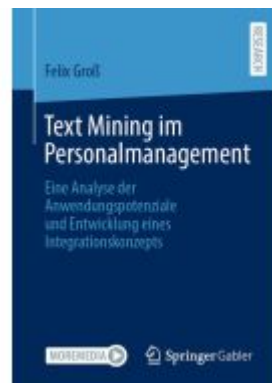
Text Mining im Personalmanagement Ladenpreis: 77,09EUR