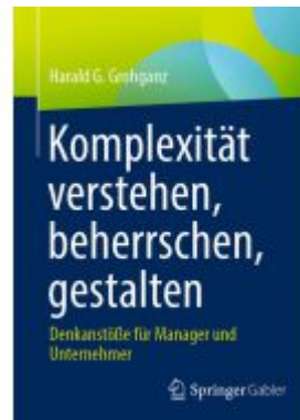
Komplexität verstehen, beherrschen, gestalten Ladenpreis: 41,11EUR