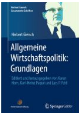
Allgemeine Wirtschaftspolitik: Grundlagen Ladenpreis: 51,39EUR