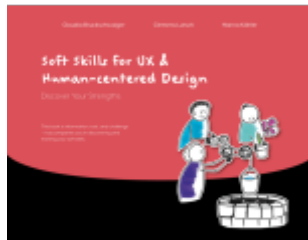
Soft Skills for UX & Human-centered Design Ladenpreis: 49,90EUR