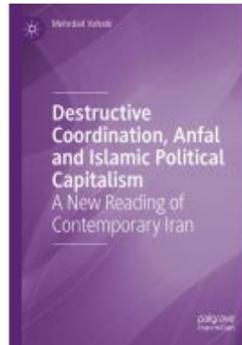
Destructive Coordination, Anfal and Islamic Political Capitalism Ladenpreis: 131,99EUR