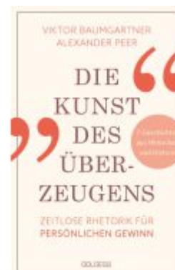
Die Kunst des Überzeugens Ladenpreis: 24,00EUR