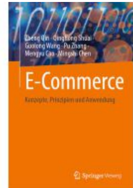
E-Commerce Ladenpreis: 51,39EUR