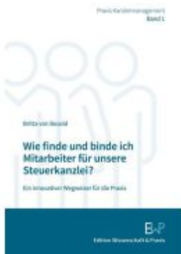
Wie finde und binde ich Mitarbeiter für unsere Steuerkanzlei? Ladenpreis: 35,90EUR