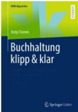
Buchhaltung klipp & klar Ladenpreis: 25,64EUR

Wir haben andere Produkte gefunden, die Ihnen gefallen könnten!