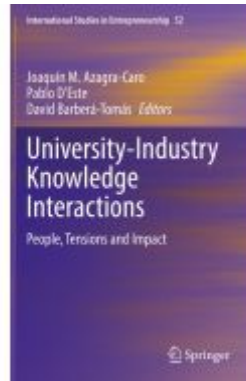
University-Industry Knowledge Interactions Ladenpreis: 120,99EUR