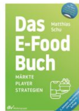
Das E-Food Buch Ladenpreis: 43,20EUR