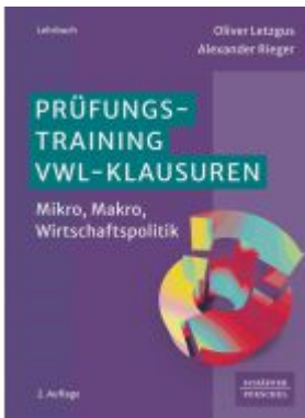
Prüfungstraining VWL-Klausuren Ladenpreis: 30,90EUR