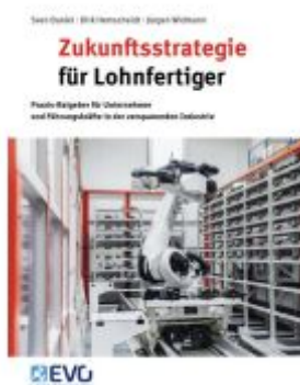
Zukunftsstrategie für Lohnfertiger Ladenpreis: 29,80EUR