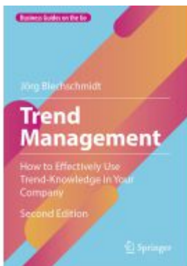
Trend Management Ladenpreis: 43,99EUR