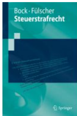
Steuerstrafrecht Ladenpreis: 30,83EUR