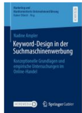
Keyword-Design in der Suchmaschinenwerbung Ladenpreis: 77,09EUR