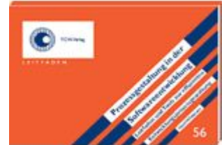
Prozessgestaltung in der Softwareentwicklung Ladenpreis: 257,10EUR