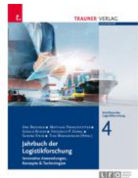
Jahrbuch der Logistikforschung Ladenpreis: 39,90EUR