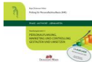
Personalfachkaufleute - Frage-Antwort- Karten Handlungsbereich 3: Personalplanung, -marketing und - controlling Ladenpreis: 28,95EUR