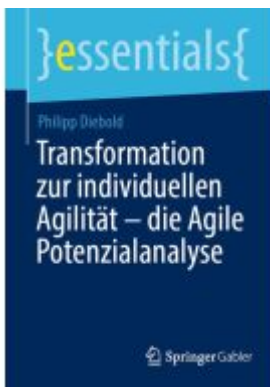
Transformation zur individuellen Agilität – die Agile Potenzialanalyse Ladenpreis: 15,41EUR