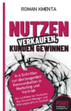
Nutzen verkaufen, Kunden gewinnen