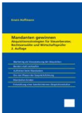
Mandanten gewinnen – Akquisitionsstrategien für Steuerberater, Rechtsanwälte und Wirtschaftsprüfer Ladenpreis: 92,50EUR