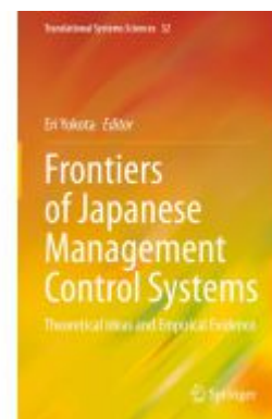
Frontiers of Japanese Management Control Systems Ladenpreis: 175,99EUR