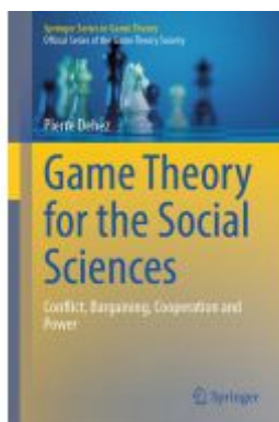
Game Theory for the Social Sciences Ladenpreis: 65,99EUR