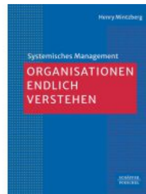
Organisationen endlich verstehen Ladenpreis: 30,90EUR