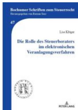
Die Rolle des Steuerberaters im elektronischen Veranlagungsverfahren