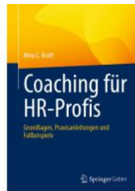
Coaching für HR-Profis