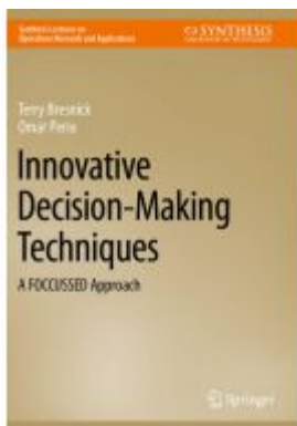
Innovative Decision-Making Techniques