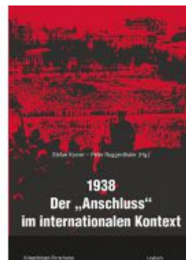
1938 – Der »Anschluss« im internationalen Kontext Ladenpreis: 29,90 EUR