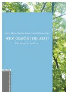
Wem gehört die Zeit? Ladenpreis: 18,90 EUR