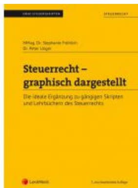
Steuerrecht - graphisch dargestellt (Skriptum) Ladenpreis: 22,00 EUR