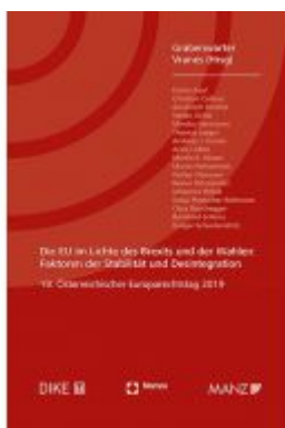
Die EU im Lichte des Brexits und der Wahlen Europarechtstag 2019 Ladenpreis: 58,00 EUR