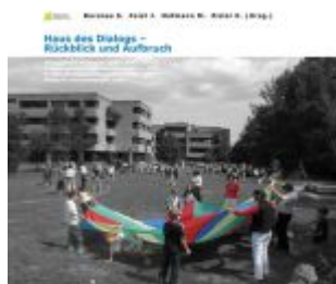
Haus des Dialogs – Rückblick und Aufbruch Ladenpreis: 19,90 EUR