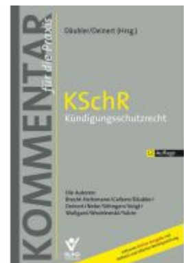
KSchR - Kündigungsschutzrecht Ladenpreis: 255,00EUR