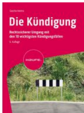
Die Kündigung Ladenpreis: 51,40EUR