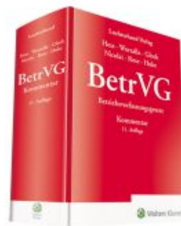
Kommentar zum Betriebsverfassungsgesetz Ladenpreis: 204,60EUR