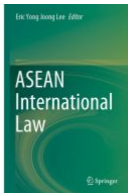
ASEAN International Law Ladenpreis: 219,99EUR