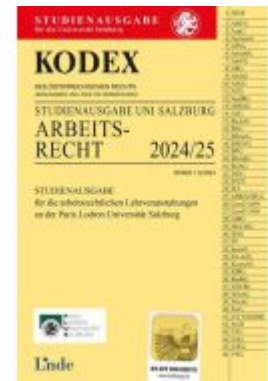
KODEX Studienausgabe Arbeitsrecht Salzburg 2024/25 Aktionspreis: 12,00EUR Ladenpreis: 13,50EUR