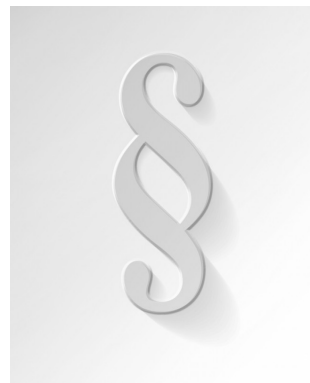
The Lighthouse Function of Social Law Ladenpreis: 219,99EUR