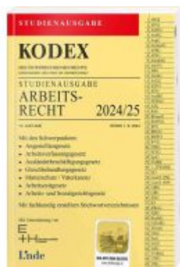
KODEX Studienausgabe Arbeitsrecht 2024/25 Ladenpreis: 15,00EUR