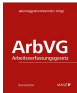
Kommentar zum Arbeitsverfassungsgesetz Ladenpreis: 188,00EUR