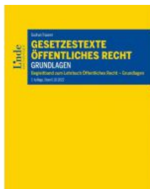
Gesetzestexte Öffentliches Recht - Grundlagen Ladenpreis: 32,00 EUR