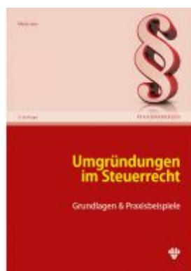
Umgründungen im Steuerrecht Ladenpreis: 59,40 EUR