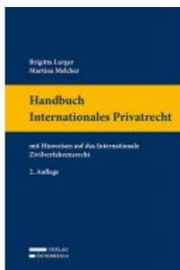
Handbuch Internationales Privatrecht Ladenpreis: 119,00 EUR