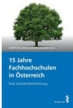
15 Jahre Fachhochschulen in Österreich Ladenpreis: 29,80 EUR

Wir haben andere Produkte gefunden, die Ihnen gefallen könnten!