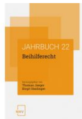
Beihilferecht Ladenpreis: 88,00 EUR