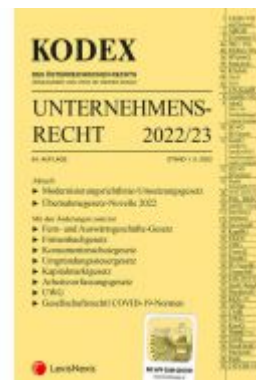
KODEX Unternehmensrecht 2022/23 - inkl. App Ladenpreis: 37,50 EUR