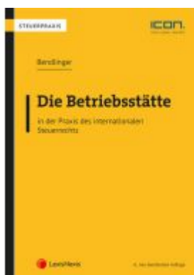
Die Betriebsstätte in der Praxis des internationalen Steuerrechts Ladenpreis: 86,00 EUR