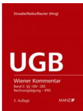
Wiener Kommentar zum UGB Rechnungslegung, 3. Auflage Ladenpreis: 328,00 EUR