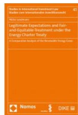
Legitimate Expectations and Fair-and- Equitable-Treatment under the Energy Charter Treaty Ladenpreis: 100,80 EUR