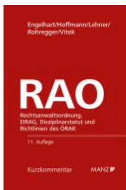
Rechtsanwaltsordnung RAO Ladenpreis: 210,00EUR