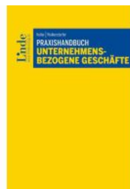
Praxishandbuch Unternehmensbezogene Geschäfte Ladenpreis: 48,00EUR