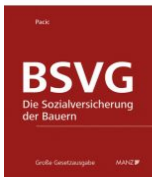
Die Sozialversicherung der Bauern BSVG Ladenpreis: 296,00 EUR