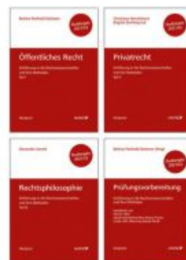
PAKET: Prüfungsvorbereitung + Einführung in die Rechtswissenschaften und ihre Methoden: TI. I + TI. II + TI. III Ladenpreis: 44,00 EUR