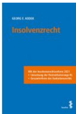
Insolvenzrecht Ladenpreis: 34,00 EUR