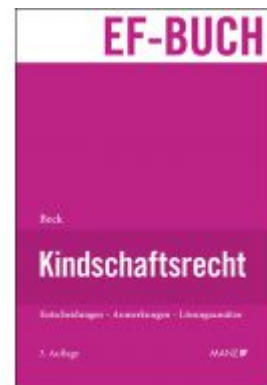
Kindschaftsrecht Ladenpreis: 168,00 EUR