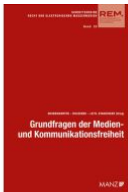
Grundfragen der Medien- und Kommunikationsfreiheit Ladenpreis: 64,00EUR