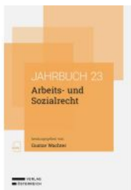
Arbeits- und Sozialrecht Ladenpreis: 74,00EUR