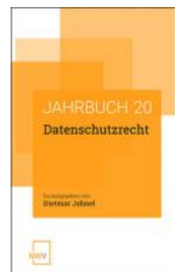
Datenschutzrecht Ladenpreis: 62,00 EUR