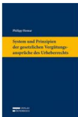
System und Prinzipien der gesetzlichen Vergütungsansprüche des Urheberrechts Ladenpreis: 129,00 EUR