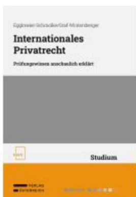
Internationales Privatrecht Ladenpreis: 38,00EUR