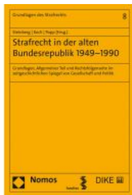
Strafrecht in der alten Bundesrepublik 1949-1990 Ladenpreis: 153,20 EUR