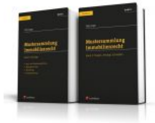
PAKET: Mustersammlung Immobilienrecht Ladenpreis: 79,20 EUR