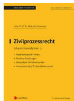
Zivilprozessrecht Erkenntnisverfahren 3 (Skriptum) Ladenpreis: 22,50EUR