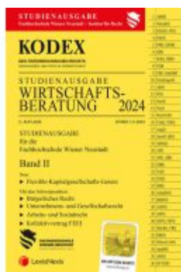
KODEX Wirtschaftsberatung 2024 Band II - inkl. App Ladenpreis: 22,00EUR