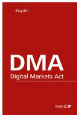
DMA - Digital Markets Act Ladenpreis: 34,00EUR

Wir haben andere Produkte gefunden, die Ihnen gefallen könnten!