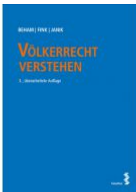
Völkerrecht verstehen Ladenpreis: 42,00 EUR