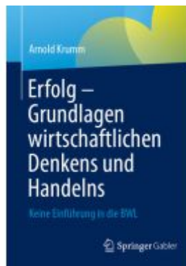
Erfolg – Grundlagen wirtschaftlichen Denkens und Handelns Ladenpreis: 28,77EUR