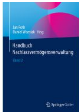
Handbuch Nachlassvermögensverwaltung Ladenpreis: 61,67EUR