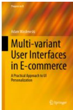
Multi-variant User Interfaces in E-commerce Ladenpreis: 93,49EUR