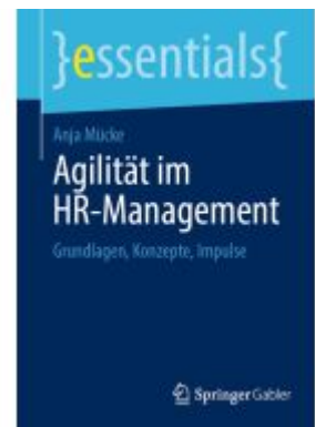
Agilität im HR-Management Ladenpreis: 15,41EUR