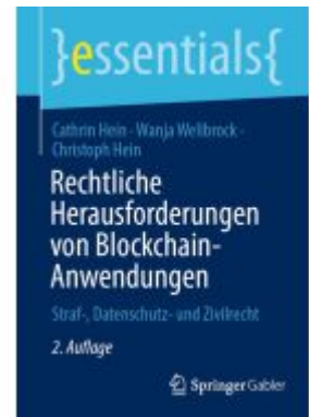
Rechtliche Herausforderungen von Blockchain-Anwendungen Ladenpreis: 15,41EUR