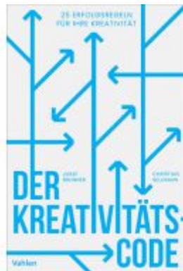
Der Kreativitätscode Ladenpreis: 30,70EUR