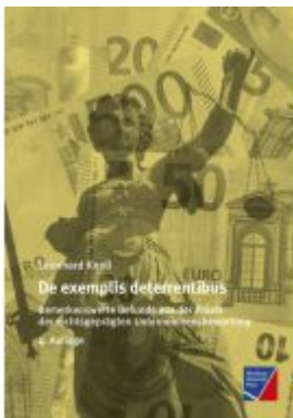
De exemplis deterrentibus Ladenpreis: 38,90EUR