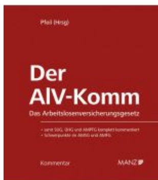
Der AIV-Komm Das Arbeitslosenversicherungsgesetz Ladenpreis: 198,00EUR

Wir haben andere Produkte gefunden, die Ihnen gefallen könnten!