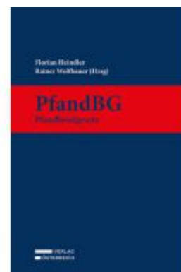
PfandBG - Pfandbriefgesetz Ladenpreis: 149,00EUR