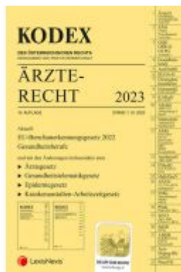
KODEX Ärzterecht 2023 - inkl. App Ladenpreis: 99,00EUR