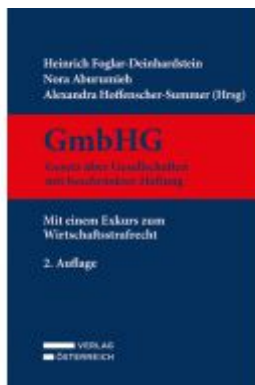
GmbHG - Gesetz über Gesellschaften mit beschränkter Haftung Ladenpreis: 329,00EUR