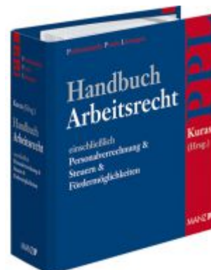
Handbuch Arbeitsrecht Ladenpreis: 198,00EUR