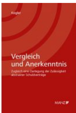
Vergleich und Anerkenntnis Ladenpreis: 84,00EUR