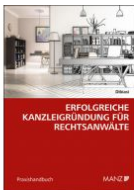
Erfolgreiche Kanzleigründung für Rechtsanwälte Ladenpreis: 34,00EUR