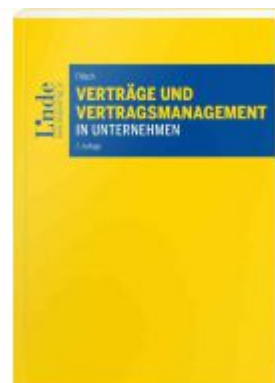
Verträge und Vertragsmanagement in Unternehmen Ladenpreis: 64,00EUR