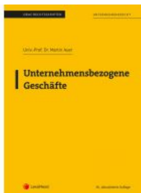
Unternehmensbezogene Geschäfte (Skriptum) Ladenpreis: 23,75EUR