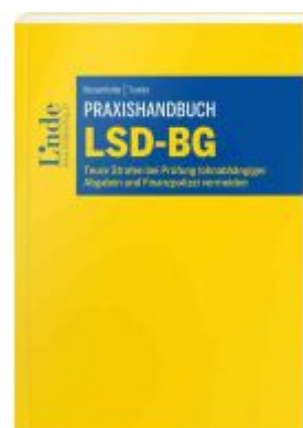
Praxishandbuch LSD-BG Ladenpreis: 42,00 EUR