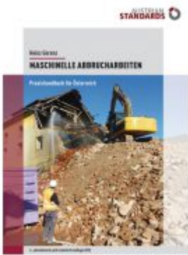
Maschinelle Abbrucharbeiten Ladenpreis: 75,90 EUR

Wir haben andere Produkte gefunden, die Ihnen gefallen könnten!