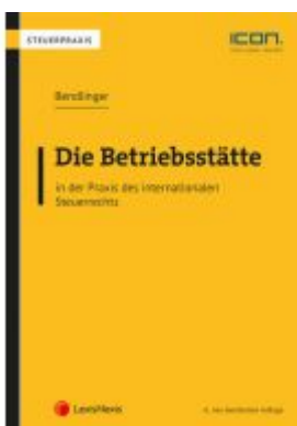
Die Betriebsstätte in der Praxis des internationalen Steuerrechts Ladenpreis: 86,00 EUR