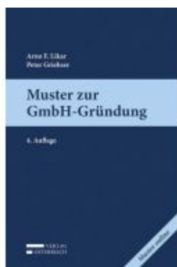
Muster zur GmbH-Gründung Ladenpreis: 52,00 EUR