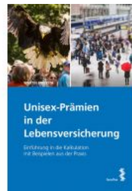
Unisex-Prämien in der Lebensversicherung Ladenpreis: 30,00 EUR