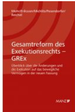
Gesamtreform des Exekutionsrechts - GREx Ladenpreis: 39,80 EUR