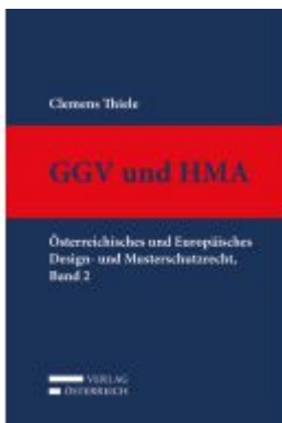
GGV und HMA Ladenpreis: 329,00 EUR