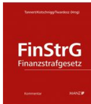
Finanzstrafgesetz Ladenpreis: 348,00 EUR