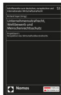
Unternehmensstrafrecht, Wettbewerb und Menschenrechtsschutz