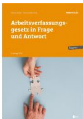
Arbeitsverfassungsgesetz in Frage und Antwort