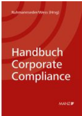
Handbuch Corporate Compliance Ladenpreis: 210,00EUR

Wir haben andere Produkte gefunden, die Ihnen gefallen könnten!