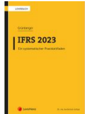
IFRS 2023 Ladenpreis: 48,00EUR