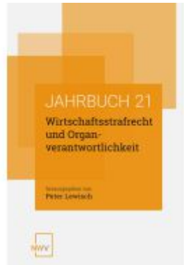
Wirtschaftsstrafrecht und Organverantwortlichkeit Ladenpreis: 62,00EUR