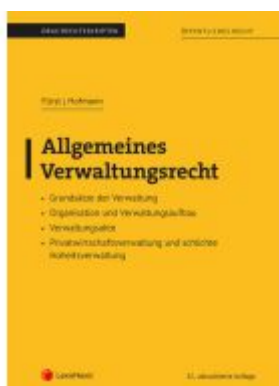
Allgemeines Verwaltungsrecht (Skriptum)