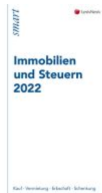
Immobilien und Steuern 2022 Ladenpreis: 12,00EUR