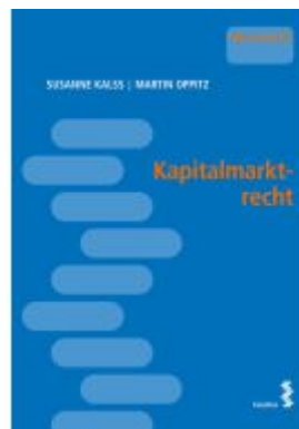
Kapitalmarktrecht Ladenpreis: 16,00EUR