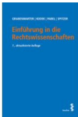
Einführung in die Rechtswissenschaften