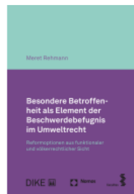
Besondere Betroffenheit als Element der Beschwerdebefugnis im Umweltrecht Ladenpreis: 117,20EUR