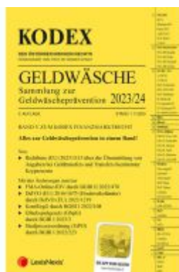
KODEX Finanzmarktrecht Band V 2023/24 - inkl. App Ladenpreis: 65,00EUR