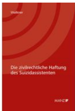
Die zivilrechtliche Haftung des Suizidassistenten