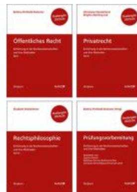
PAKET: Prüfungsvorbereitung + Einführung in die Rechtswissenschaften und ihre Methoden: Tl. I + Tl. II + Tl. III