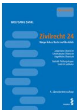
Zivilrecht 24 Ladenpreis: 28,00EUR