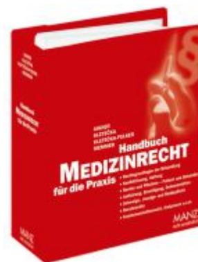
Handbuch Medizinrecht für die Praxis Ladenpreis: 198,00EUR