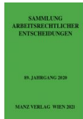
Sammlung arbeitsrechtlicher Entscheidungen Ladenpreis: 48,00 EUR