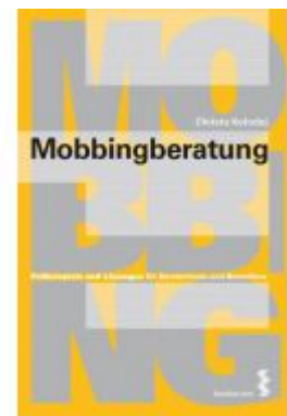
Mobbingberatung Ladenpreis: 19,90 EUR