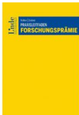
Praxisleitfaden Forschungsprämie Ladenpreis: 58,00 EUR