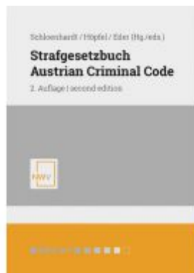
Strafgesetzbuch / Austrian Criminal Code Ladenpreis: 98,00 EUR