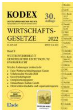
KODEX Wirtschaftsgesetze Band II 2022 Ladenpreis: 61,00 EUR