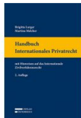
Handbuch Internationales Privatrecht Ladenpreis: 119,00 EUR