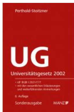
Universitätsgesetz 2002 Ladenpreis: 89,00 EUR