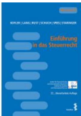
Einführung in das Steuerrecht Ladenpreis: 24,00EUR