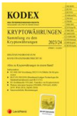
Kodex Kryptowährungen Ladenpreis: 30,00EUR