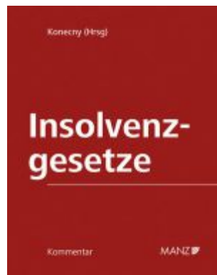
Kommentar zu den Insolvenzgesetzen Ladenpreis: 390,00EUR