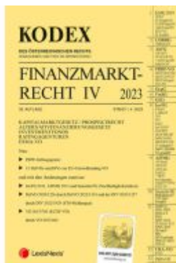
KODEX Finanzmarktrecht Band IV 2023 Ladenpreis: 86,00EUR