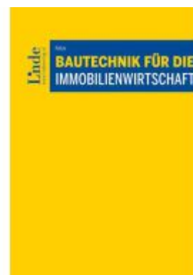
Bautechnik für die Immobilienwirtschaft Ladenpreis: 96,00EUR