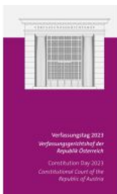
Verfassungstag 2023 Ladenpreis: 32,00EUR