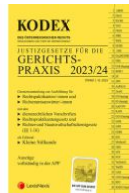
KODEX Gerichtspraxis 2023/24 - inkl. App Ladenpreis: 24,00EUR