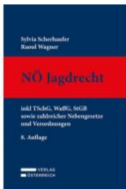
Nö Jagdrecht Ladenpreis: 189,00EUR