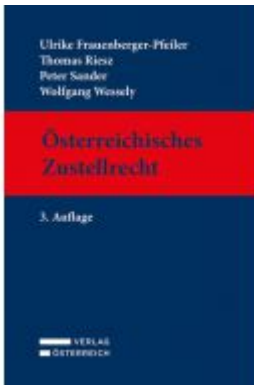
Österreichisches Zustellrecht Ladenpreis: 169,00 EUR