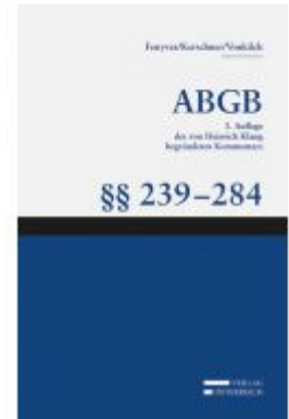
Großkommentar zum ABGB - Klang Kommentar Ladenpreis: 217,80 EUR