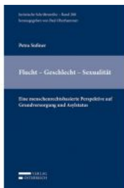
Flucht - Geschlecht - Sexualität Ladenpreis: 98,00 EUR