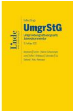
UmgrStG | Umgründungssteuergesetz 2021 Ladenpreis: 245,00 EUR