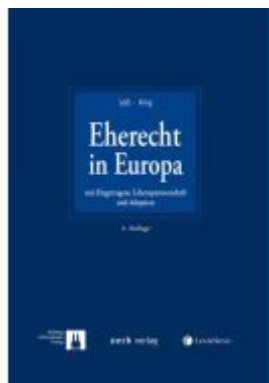
Eherecht in Europa Ladenpreis: 169,00 EUR