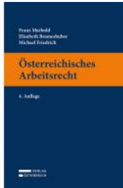
Österreichisches Arbeitsrecht Ladenpreis: 89,00 EUR