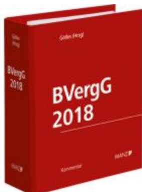
BVerG 2018 Ladenpreis: 258,00 EUR

Wir haben andere Produkte gefunden, die Ihnen gefallen könnten!