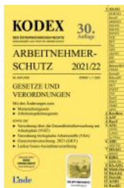
KODEX Arbeitnehmerschutz 2021/22 Ladenpreis: 38,00 EUR