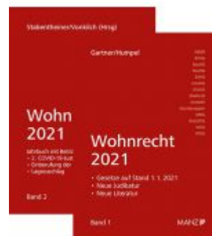
PAKET: Wohnrecht 2021 Band 1 + 2 Ladenpreis: 74,00 EUR