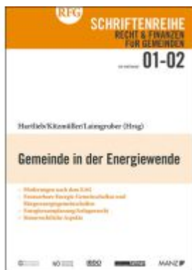
Gemeinde in der Energiewende Ladenpreis: 29,80EUR