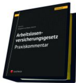
Arbeitslosenversicherungsgesetz - Praxiskommentar Ladenpreis: 290,00EUR