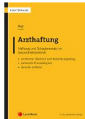
Arzthaftung Ladenpreis: 49,00EUR