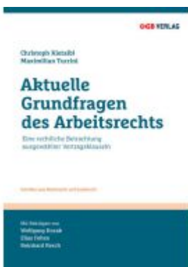
Aktuelle Grundfragen des Arbeitsrechts