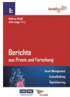
Berichte aus Praxis und Forschung - Asset Management. Instandhaltung. Digitalisierung.