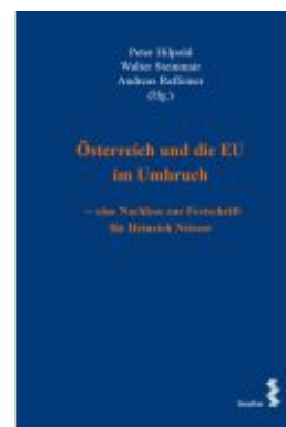
Österreich und die EU im Umbruch – eine Nachlese zur Festschrift für Heinrich Neisser