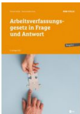
Arbeitsverfassungsgesetz in Frage und Antwort

Wir haben andere Produkte gefunden, die Ihnen gefallen könnten!