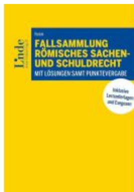
Fallsammlung Römisches Sachen- und Schuldrecht