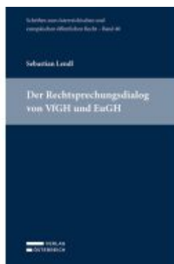
Der Rechtsprechungsdialog von VfGH und EuGH