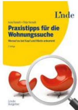
Praxistipps für die Wohnungssuche Ladenpreis: 29,90EUR