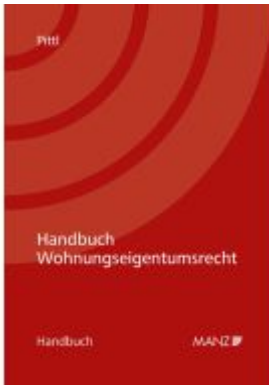
Handbuch Wohnungseigentumsrecht Ladenpreis: 56,00EUR