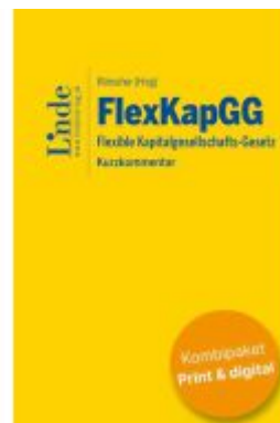
FlexKapGG | Flexible Kapitalgesellschafts- Gesetz (Kombi Print&digital) Ladenpreis: 99,00EUR