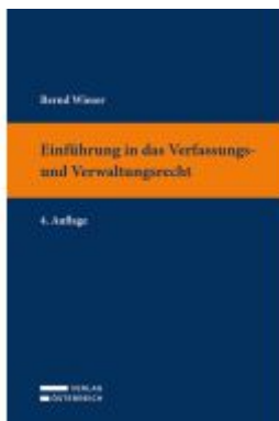
Einführung in das Verfassungs- und Verwaltungsrecht Ladenpreis: 36,00EUR