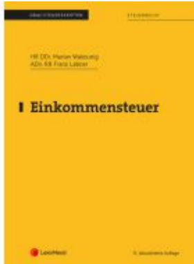
Einkommensteuer (Skriptum) Ladenpreis: 36,00EUR