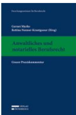
Anwaltliches und notarielles Berufsrecht Ladenpreis: 389,00EUR