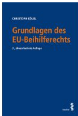
Grundlagen des EU-Beihilferechts Ladenpreis: 66,00EUR

Wir haben andere Produkte gefunden, die Ihnen gefallen könnten!