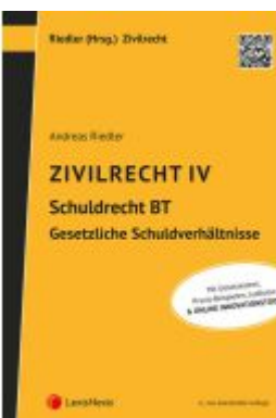
Zivilrecht IV - Schuldrecht Besonderer Teil - Gesetzliche Schuldverhältnisse Ladenpreis: 42,00EUR