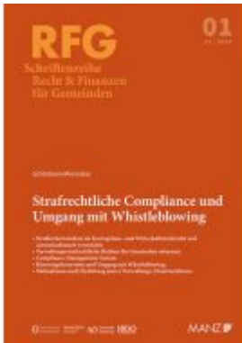
Strafrechtliche Compliance und Umgang mit Whistleblowing Ladenpreis: 24,80EUR