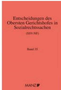
Entscheidungen des obersten Gerichtshofes in Sozialrechtssachen SSV-NF Ladenpreis: 164,80EUR