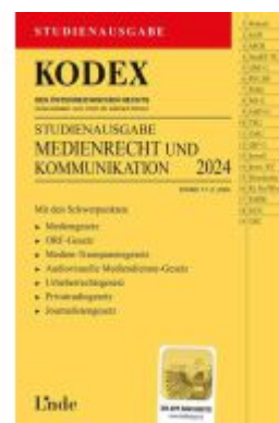
KODEX Studienausgabe Medienrecht und Kommunikation Ladenpreis: 15,00EUR