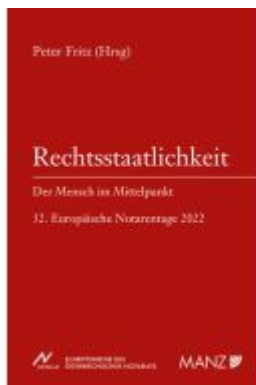
Rechtsstaatlichkeit - Der Mensch im Mittelpunkt Ladenpreis: 22,80EUR