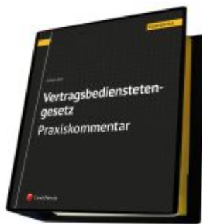
Vertragsbedienstetengesetz - Praxiskommentar Ladenpreis: 330,00EUR