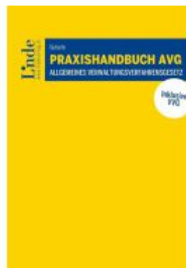
Praxishandbuch AVG | Allgemeines Verwaltungsverfahrensgesetz Ladenpreis: 49,00EUR