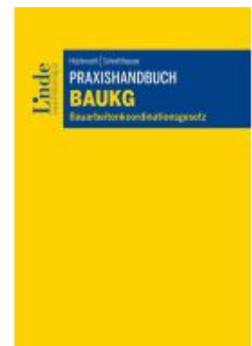
Praxishandbuch BauKG Ladenpreis: 49,00EUR