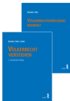
Kombipaket Völkerrecht verstehen und Völkerrechtsprechung kompakt Ladenpreis: 53,00EUR