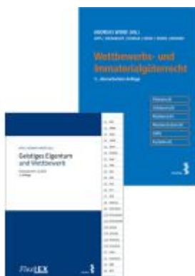
Kombipaket Wettbewerbs- und Immaterialgüterrecht und FlexLex Geistiges Eigentum und Wettbewerb Ladenpreis: 74,00EUR