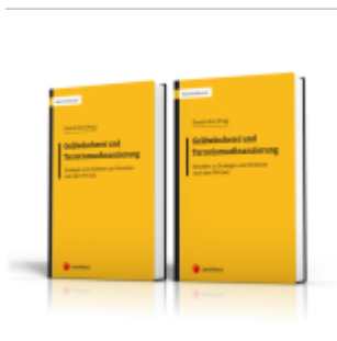
PAKET Geldwäsche und Terrorismusfinanzierung Ladenpreis: 52,00EUR

Wir haben andere Produkte gefunden, die Ihnen gefallen könnten!