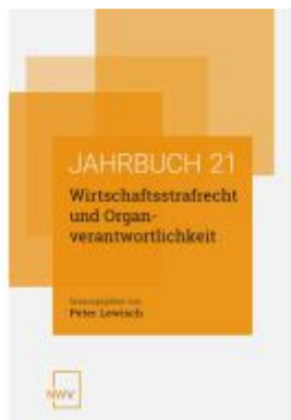
Wirtschaftsstrafrecht und Organverantwortlichkeit