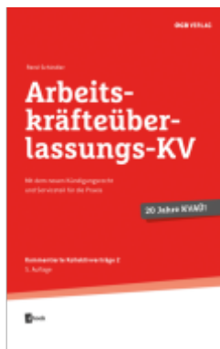
Arbeitskräfteüberlassungs-KV Ladenpreis: 42,00EUR