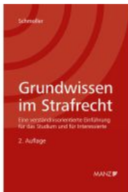
Grundwissen im Strafrecht