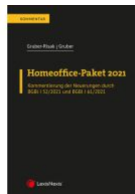
Homeoffice-Paket 2021 Ladenpreis: 27,00EUR