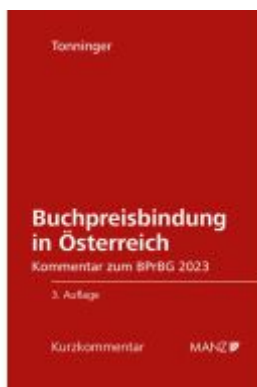
Buchpreisbindung in Österreich BPrBG 2023 Ladenpreis: 42,00EUR