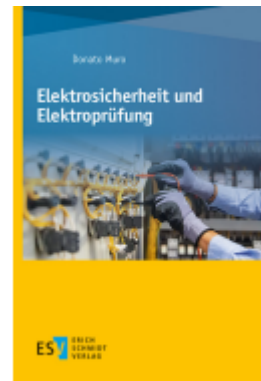
Elektrosicherheit und Elektroprüfung Ladenpreis: 30,80EUR