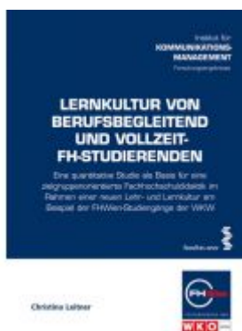
Lernkultur von berufsbegleitend und Vollzeit-FH-Studierenden Ladenpreis: 22,00 EUR