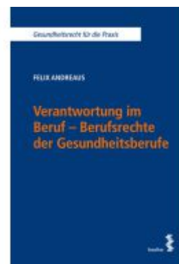
Verantwortung im Beruf - Berufsrechte der Gesundheitsberufe Ladenpreis: 42,00EUR