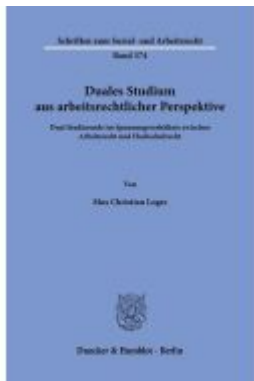
Duales Studium aus arbeitsrechtlicher Perspektive. Ladenpreis: 113,00EUR

Wir haben andere Produkte gefunden, die Ihnen gefallen könnten!