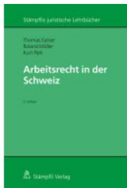
Arbeitsrecht in der Schweiz Ladenpreis: 174,10EUR