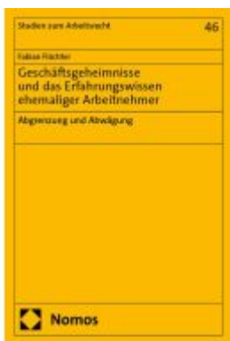
Geschäftsgeheimnisse und das Erfahrungswissen ehemaliger Arbeitnehmer Ladenpreis: 132,70EUR