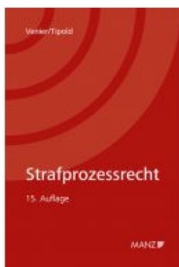
Strafprozessrecht Ladenpreis: 39,00 EUR