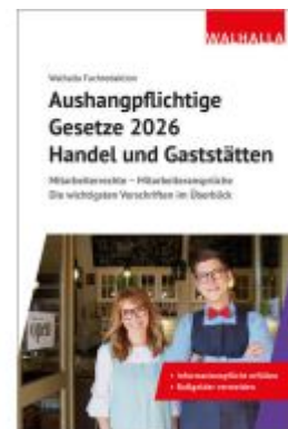
Aushangpflichtige Gesetze 2026 Handel und Gaststätten Ladenpreis: 15,40EUR