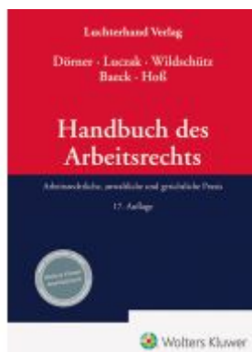
Handbuch des Arbeitsrechts Ladenpreis: 194,30EUR