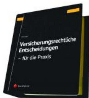
Versicherungsrechtliche Entscheidungen - aufbereitet für die Praxis Ladenpreis: 329,00 EUR