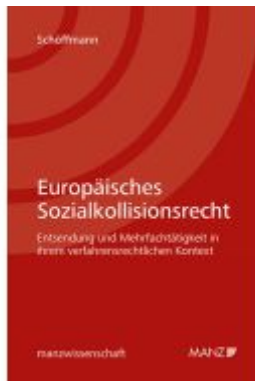
Europäisches Sozialkollisionsrecht Ladenpreis: 62,00EUR