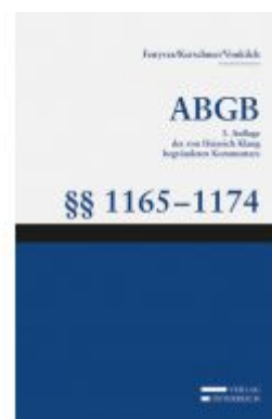
Großkommentar zum ABGB - Klang Kommentar Ladenpreis: 199,00 EUR