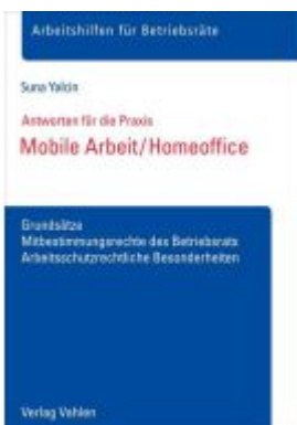
Mobile Arbeit / Homeoffice Ladenpreis: 17,40EUR