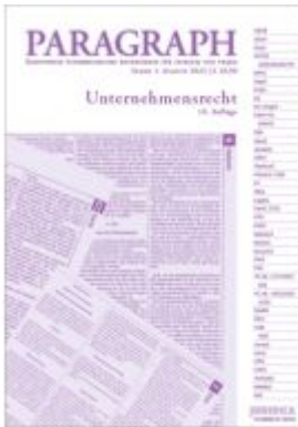
Paragraph - Unternehmensrecht Ladenpreis: 18,90EUR