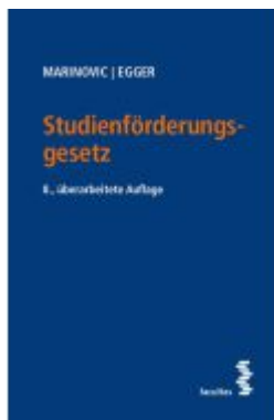
Studienförderungsgesetz Ladenpreis: 58,00EUR

Wir haben andere Produkte gefunden, die Ihnen gefallen könnten!