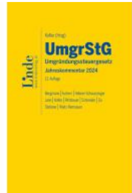
UmgrStG | Umgründungssteuergesetz 2024 Ladenpreis: 260,00EUR