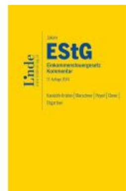
Jakom EStG | Einkommensteuergesetz 2024 Ladenpreis: 145,00EUR