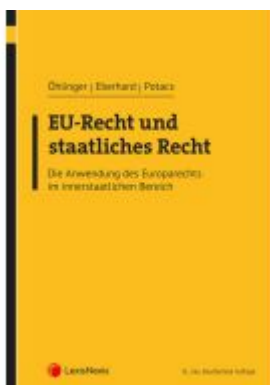
EU-Recht und staatliches Recht Ladenpreis: 54,00EUR