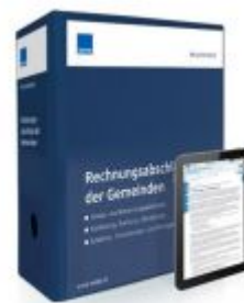
Rechnungsabschluss der Gemeinden