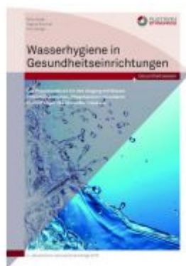
Wasserhygiene in Gesundheitseinrichtungen