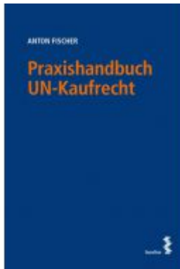
Praxishandbuch UN-Kaufrecht Ladenpreis: 48,00 EUR