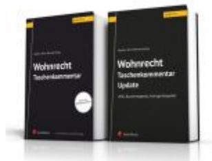
PAKET: Wohnrecht Taschenkommentar + Wohnrecht Taschenkommentar Update