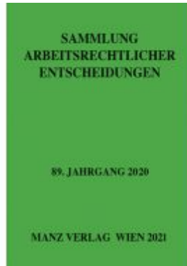
Sammlung arbeitsrechtlicher Entscheidungen Ladenpreis: 48,00 EUR