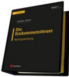
Die Einkommensteuer (EStG 1988) Band II - Rechtsprechung Ladenpreis: 295,00 EUR