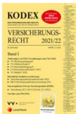
KODEX Versicherungsrecht Band I 2021/22 - inkl. App