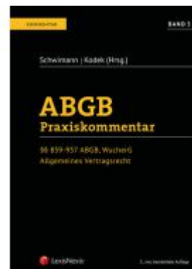
ABGB Praxiskommentar / ABGB Praxiskommentar - Band 5, 5. Auflage