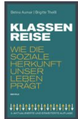
Klassenreise Ladenpreis: 24,90EUR