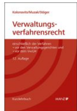
Grundriss des österreichischen Verwaltungsverfahrensrechts Ladenpreis: 76,00EUR