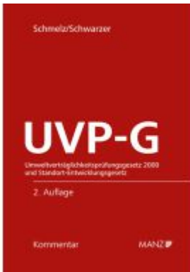
UVP-Gesetz Umweltverträglichkeitsprüfungsgesetz 2000 Ladenpreis: 348,00EUR