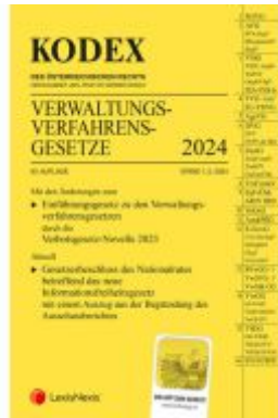
KODEX Verwaltungsverfahrensgesetze (AVG) 2024 - inkl. App Ladenpreis: 28,00EUR