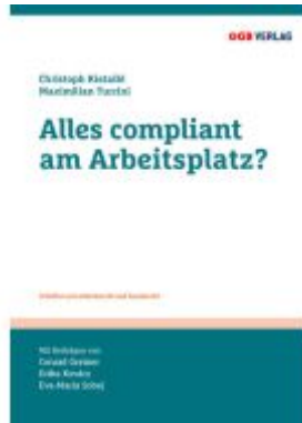
Alles compliant am Arbeitsplatz? Ladenpreis: 36,00EUR