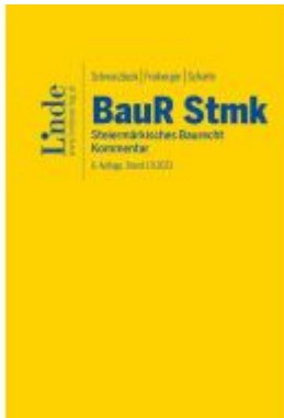
BauR Stmk. | Steiermärkisches Baurecht Ladenpreis: 249,00EUR