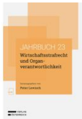
Wirtschaftsstrafrecht und Organverantwortlichkeit Ladenpreis: 74,00EUR